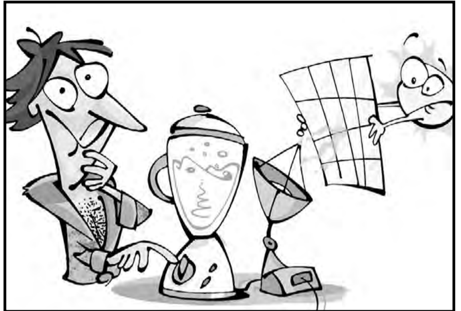
Entre estos dos dibujos, el autor ha cometido 8 errores. Descúbralos.