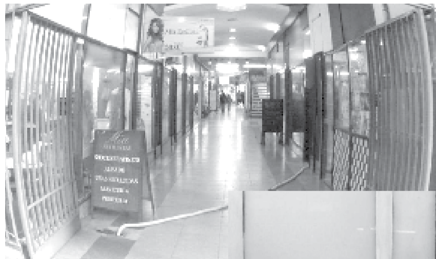
Foto: Lucía Martínez Vintage; galería comercial de estilo constructivo década 70'