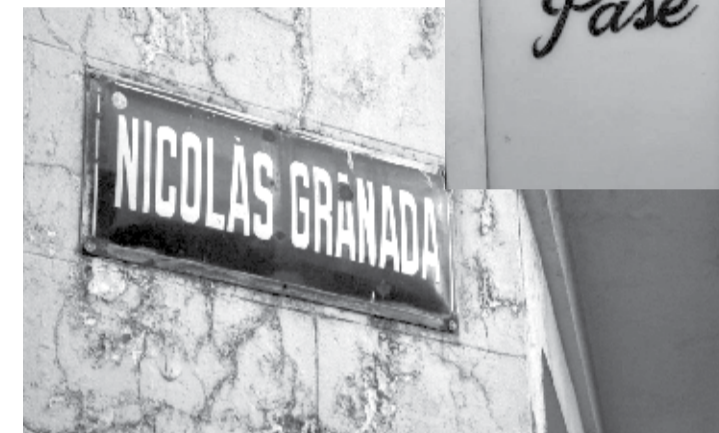
Gráfica manuscrita anterior a la era digital